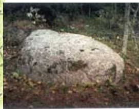
Offersten - Uhrikivi Cup stone - Opferstein