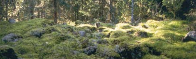
Gravröse - Røykkiö - Cairn - Grabsteinansammlung