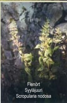
Flenört Sylläjuuri Scropularia nodosa

Öppet: maj–september Auki: toukokuu–syyskuu Open: May–September Geöffnet: Mai–September Tel. +358 6 347 7111