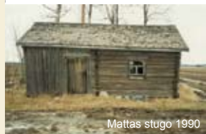
Mattas stugo 1990