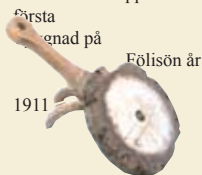
Första byggnaden på Fölisön år 1911

Malaks, skriven av Axel O. Heikel i Finskt Museum , nr 1 1904. Läs mera i boken Fåbodliv i Malax , utgiven 1987 av Aktiv närkultur. — En inredd fåbod finns vid Brinkens museum i Malax. På Fölisön i Helsingfors finns en fåbod från Limossen i Malax, uppförd som