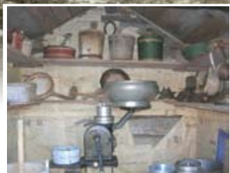
Interiörer från fäbodstugan vid Brinkens museum: i mjölkboden ovan ses en separator, filbunkar, mjölkstövror och ostbräden; till höger en interiör från fäbodstugan med dess enkla inredning. Mittemot bordet finns högsän-