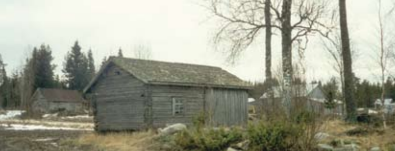
Mattias slugo 1990 (nr 1; idag bortriven).